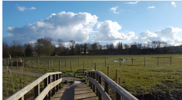
Herstelde openheid in het schootsveld